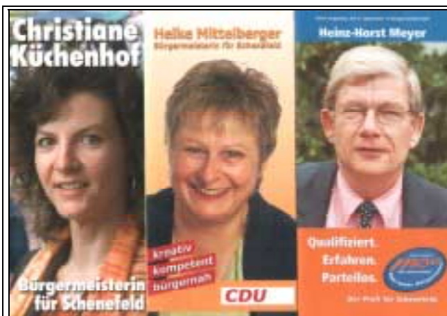
Bürgermeisterkandidaten für die Wahl am 04. Sept. 2005 in Schenefeld