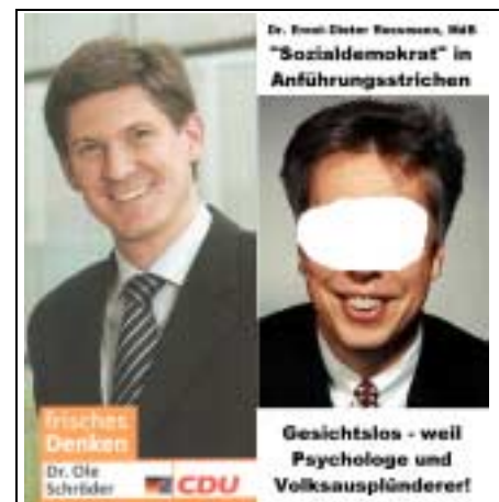
„Kandidaten“ zur Wahl 18. Sept. 2005 (Bundestag)

Holt Stimmen, wo Ihr wollt, aber nicht bei mir - basta! Stopft Eure eigenen Briefkästen voll.