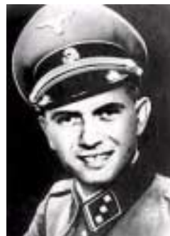
Dr. med. Josef Mengele,

Abb.2: KZ- Arzt, Anthropologe, Massenmörder